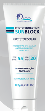
SUNBLOCK FILTRÓ SOLAR